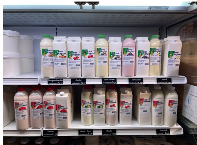
Begin November, inmiddels zit ongeveer 50% in een pak